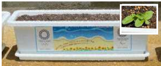
植栽をしたプランター

学校等に配付し、学校の花壇等で育てて種を収穫し、次年度さらに多くの学校等に配付することで、参加の輪を広げる」「大会開催時、JR上総一ノ宮駅前ロータリー、会場までの輸送ルート、会場周辺等にひまわりを植栽、装飾し、「おもてなし」の心で選手・関係者、観客をお迎えする」というものです。