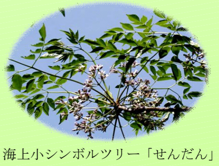
海上小シンボルツリー「せんだん」