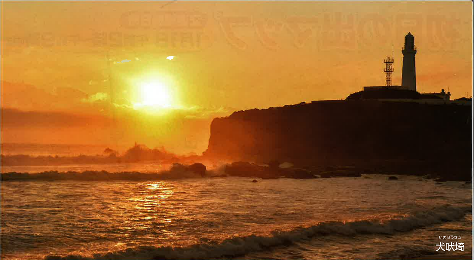
いぬぼうさき 犬吠埼