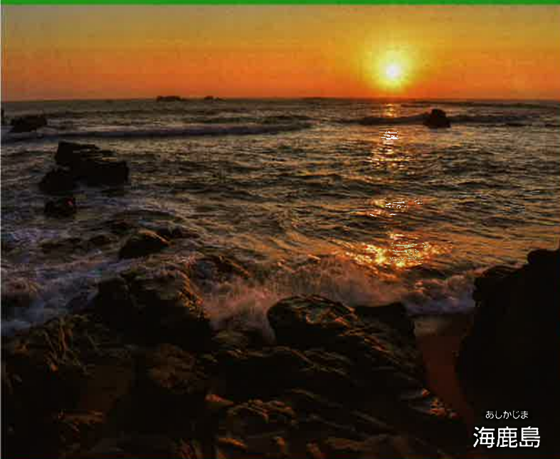
あしがしま 海鹿島