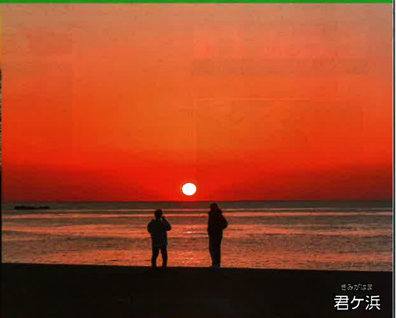
きみがはま 君ヶ浜

元日は、初日の出においでになる自動車で相当混雑するため、犬吠埼周辺にて交通規制を行います。