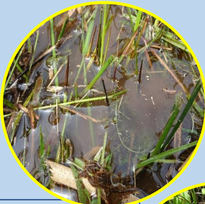
チョウシタヌキモ