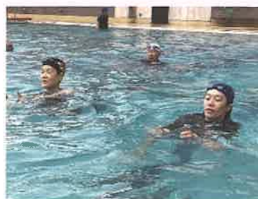
水上安全法(立ち泳ぎ)