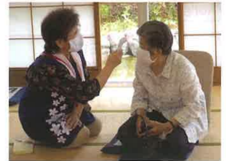
感染対策を徹底しながらの活動