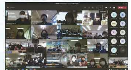
学校の垣根を超えた交流の様子