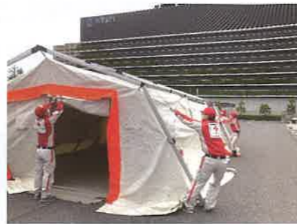
救護所用テント設営研修会