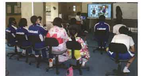
オンライン国際交流の様子