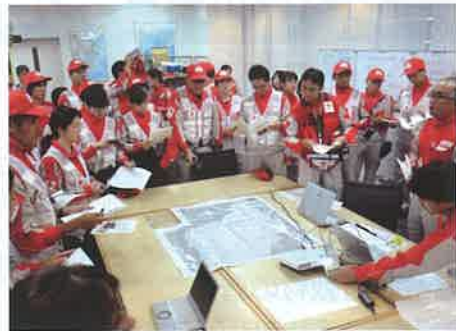
千葉県支部に参集した県内外の救護班

観測史上最強クラスの勢力で関東に上陸し、千葉県を中心に甚大な被害をもたらした台風15号。安房地域を中心に家屋の被害が甚大で、県内の広い範囲で長期間におよぶ停電が発生しました。県内外の救護班が千葉県に参集し、館山市の安房医療センターを拠点に救護活動を展開。千葉県支部からは救護班2個班と心のケア要員4名を派遣しました。