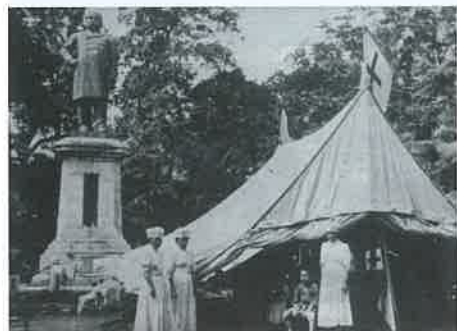
芝公園に設置された救護テント

関東地方でマグニチュード7.9の地震が発生し、死者・行方不明者が約10万人を超える未曾有の被害をもたらしました。日赤は各支部の救護班総勢4,400余名を動員し、延べ206万人余を救護。千葉県支部では、千葉・佐倉・安房に救護所を設置し93名の救護員が従事したほか、東京にも救護班2個班を派遣しました。