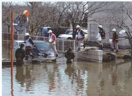
水没により孤立した避難所へ向かう救護班

宮城県沖で国内観測史上最大のマグニチュード9.0の大地震、巨大津波が襲い、死者・行方不明者は2万2303人を数えました。発災当日、日赤は全国の支部から救護班55個班を被災地に向け出発。同年9月までに894班(6,492名)を派遣し、7万5,892人を診療しました。千葉県支部では、発災直後から約半年間にわたり、医療救護班やDMAT、こころのケア班等182名を派遣しました。